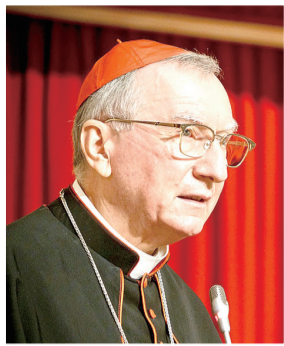
▲基金會會長帕羅林樞機 (Card. Pietro Parolin)